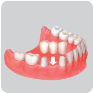
GELENEKSEL KURON VE KÖPRÜ PROTEZİ