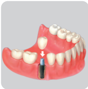
İMPLANT DESTEKLİ SABİT PROTEZ