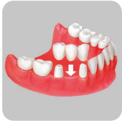
GELENEKSEL KURON VE KÖPRÜ PROTEZİ