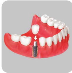
İMPLANT DESTEKLİ SABİT PROTEZ

Kliniğimizde; Trias®-ixx2® Implant Systems tercih edilmektedir.